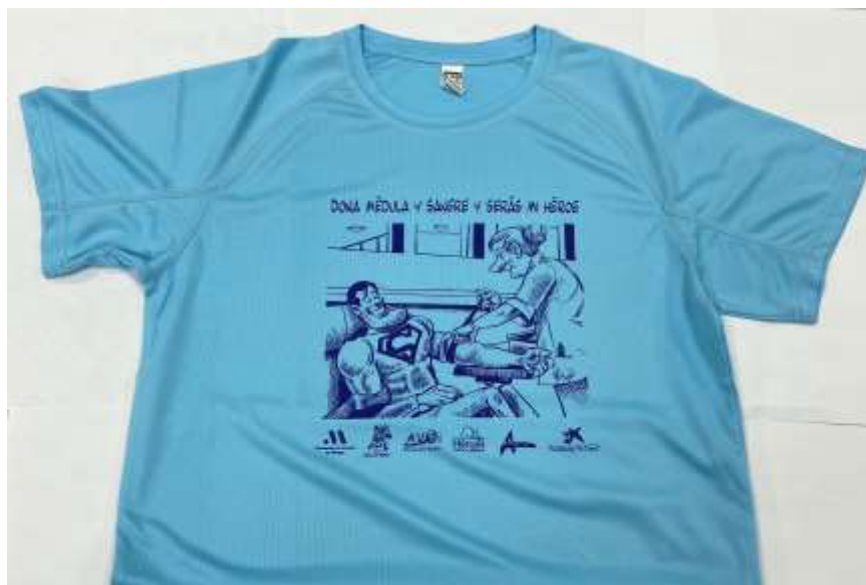
TABLA DE TALLAS DE LAS CAMISETAS SOLIDARIAS